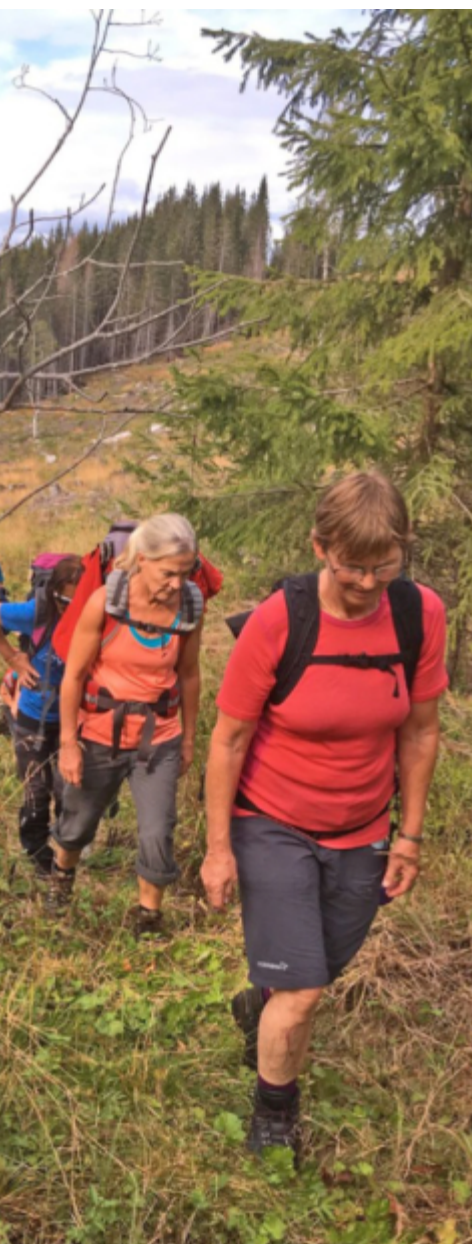
Vandring i Bygata. I 2019 ble det arrangert en vandring langs en nyryddet del av Bygata mellom Hammeren og Jevnaker.