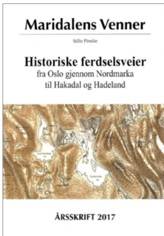
Maridalens venners årbok for 2017