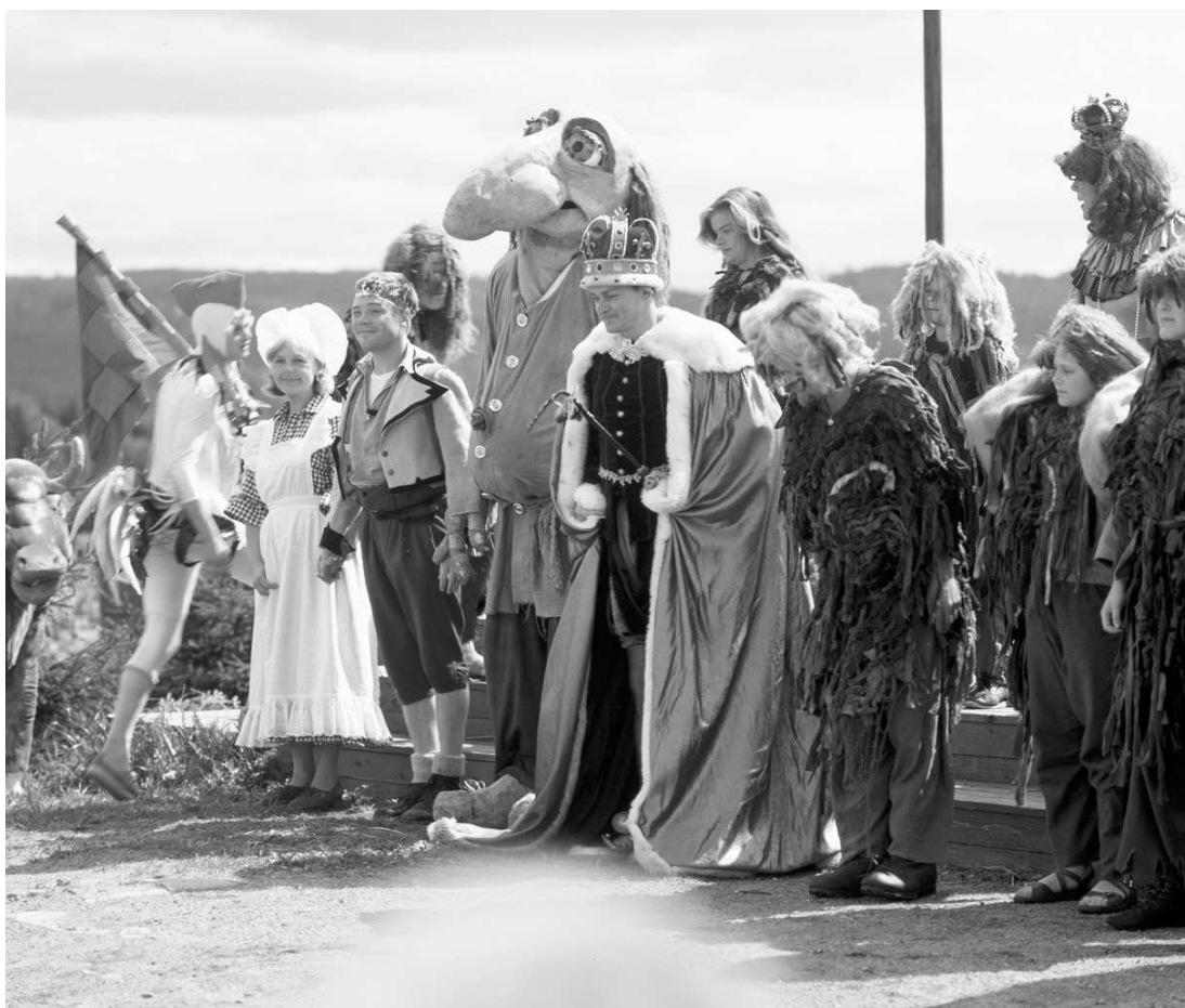
Prinsessa og Trollnøkkelen i 1987