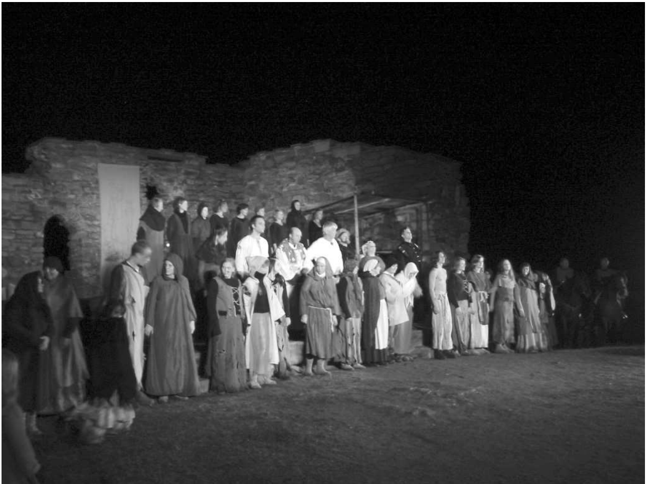
Fra kveldsforestillingen.