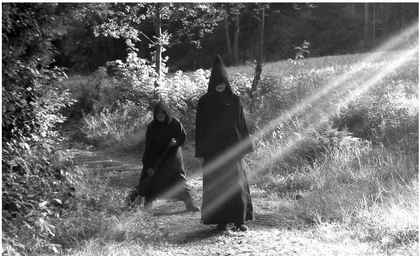
Fra Tablåene i skogen.

Skoleforestillingen ble en suksess, med nesten 700 elever fra Grefsen vgs og Engebråten ungdomsskole. Grefsen har hatt Engelstads Svartedauen som pensum og de var svært takknemlige for forestillingen satt opp spesielt for dem! Det var en regntung dag, men det ble heldigvis opphold under forestillingen, femten minutter senere høljet det ned. Det spøkte også for fullmåneforestillingen kl. 20.59 den 30.8,