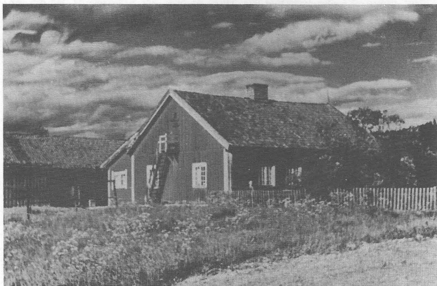
Slik så det ut på Lillestrand