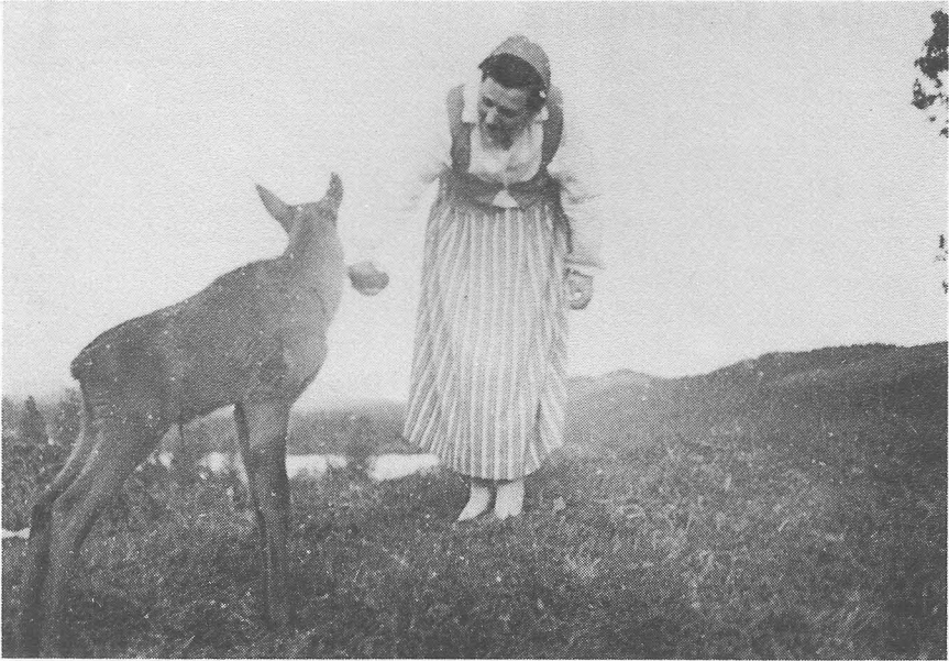
Også viltpleie — på Sandungen. Den var nok kommet vekk fra mora og var glad ved å få melk av flaske ei tid.

ble merket i Oslo for 1 år siden, er funnet igjen utenfor Moskva.